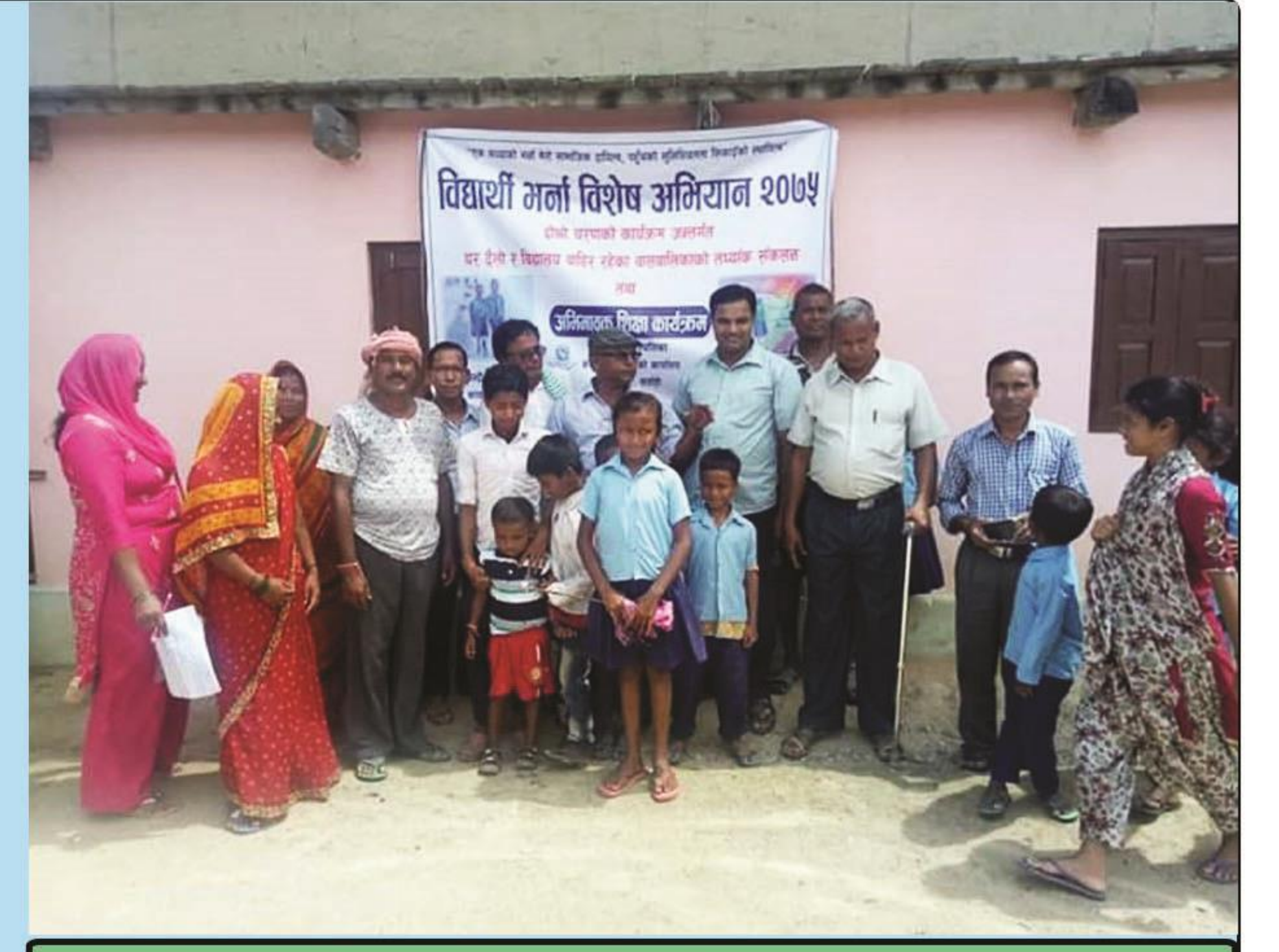
विशेष विद्यार्थी भर्ना अभियान, २०७५