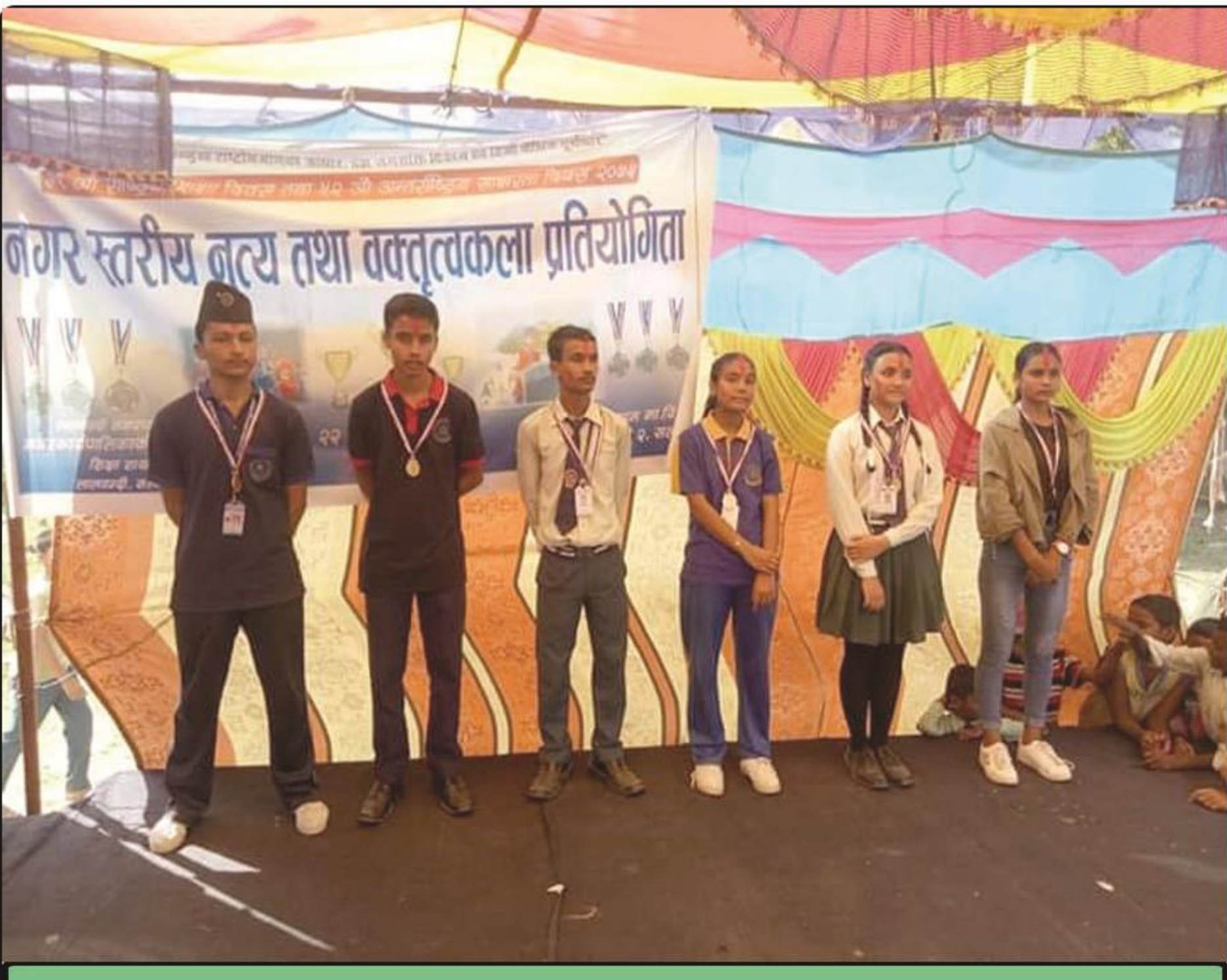
नगर स्तरीय नृत्य तथा वक्तृत्वकला प्रतियोगिता, २०७५