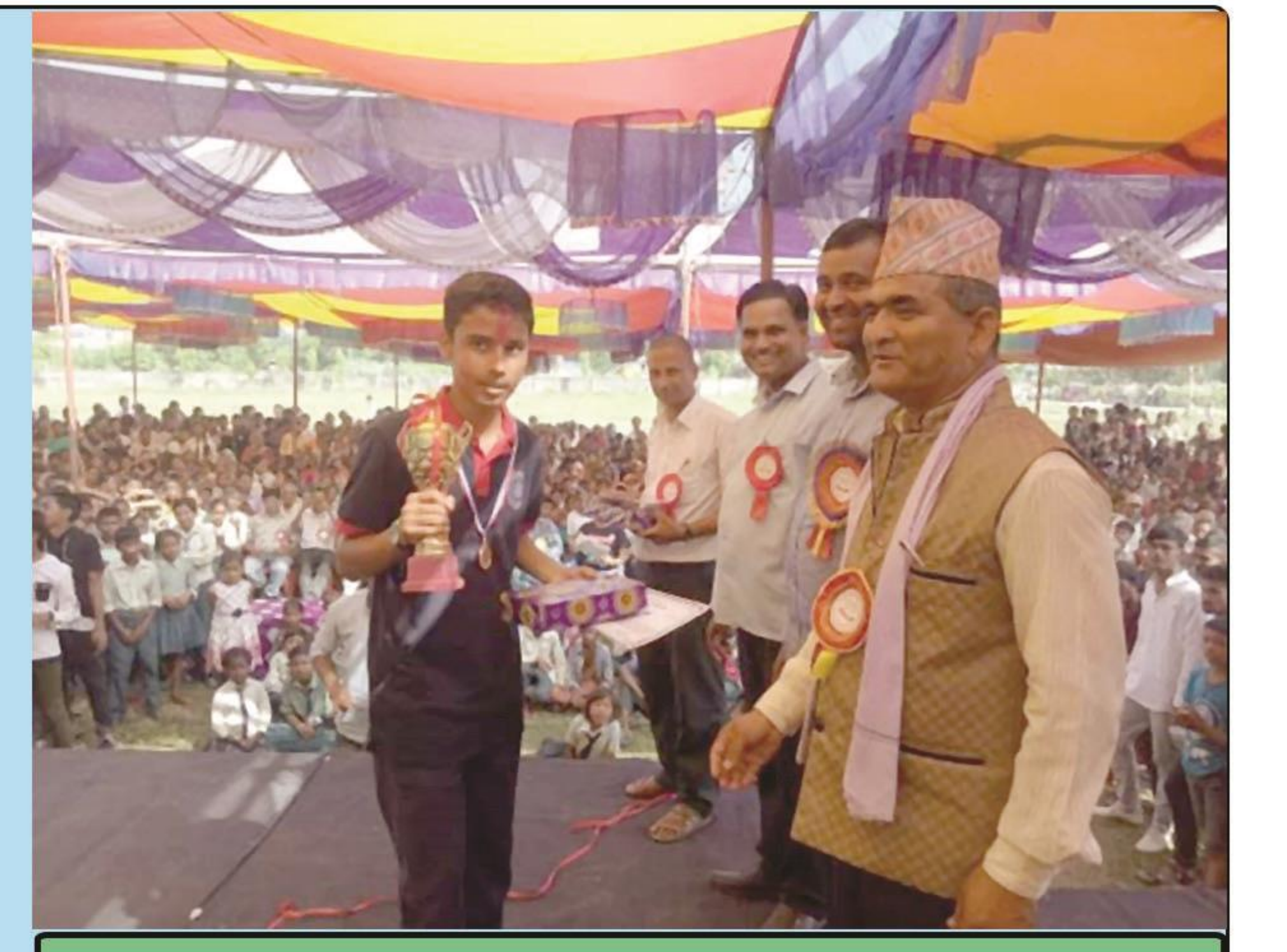
नगर स्तरीय नृत्य तथा वक्तृत्वकला प्रतियोगिता, २०७५