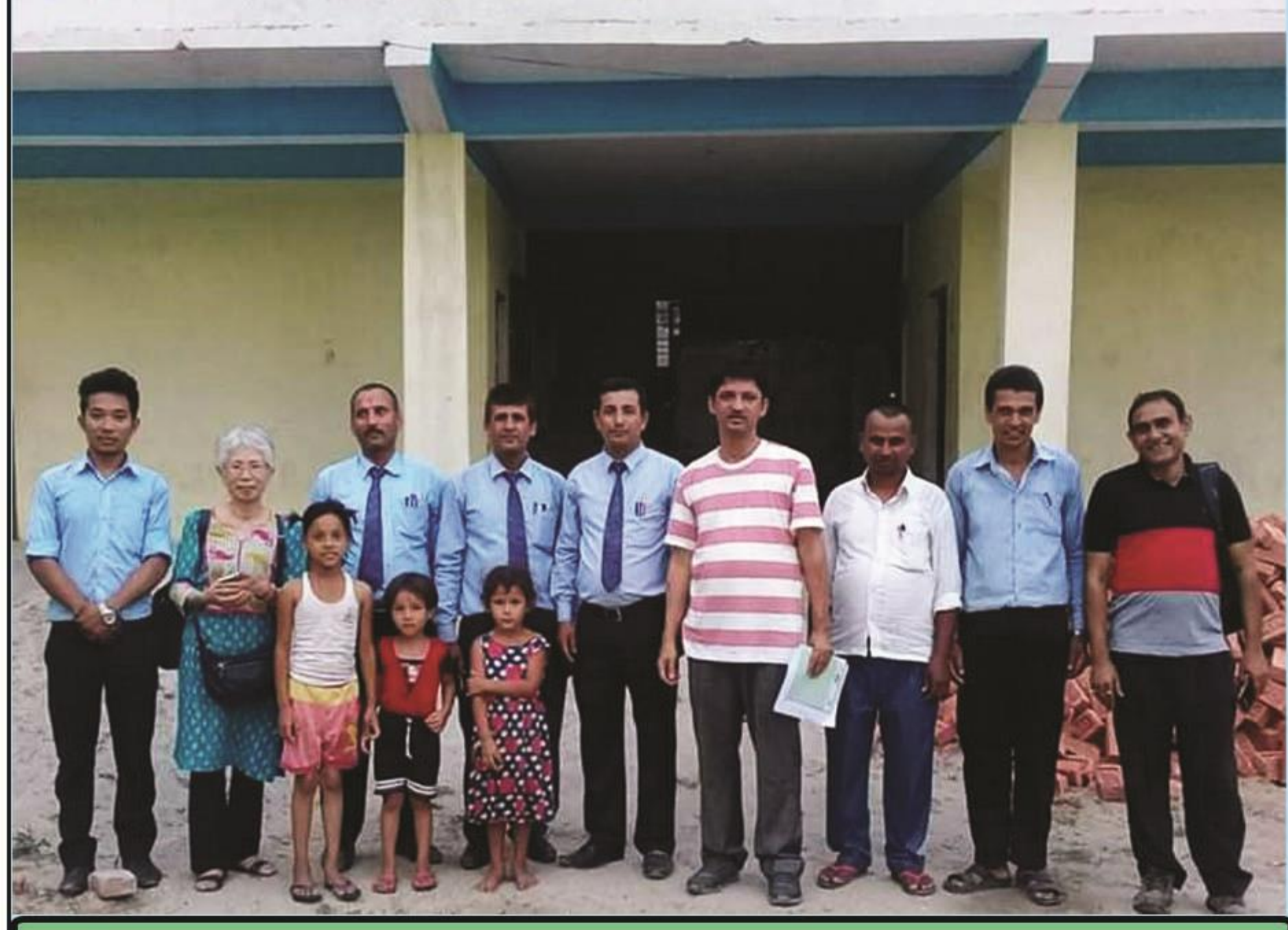
विद्यालय सुधार योजना कार्यशाला, २०७५