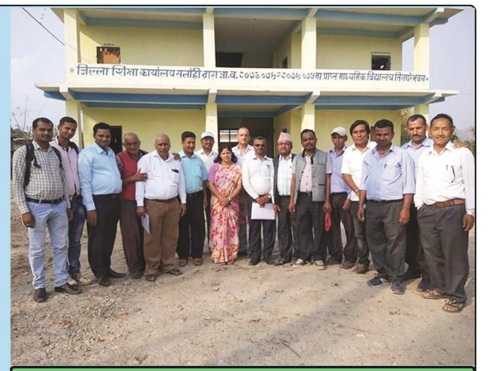
OSC व्यवस्थापन सम्बन्धी कार्यशाला, २०७५